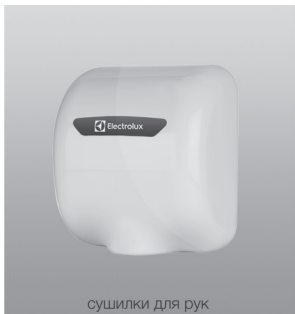
сушилки для рук